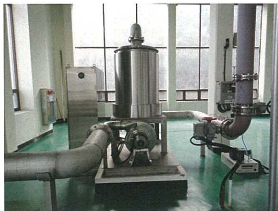
< 축매식 오존분해장치 >

- 유도형전력량계 (대한전선, TS-4), 교류 3상 4선식, 380V, 10A